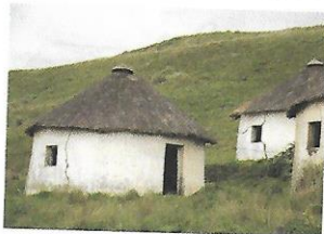
'n Vroeë Xhosa-hut wat 'n ungqu-phantsi of rontabile genoem word.