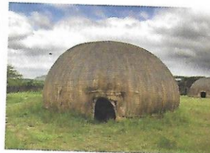
Die Nama gebruik nog steeds hierdie matjieshuise .