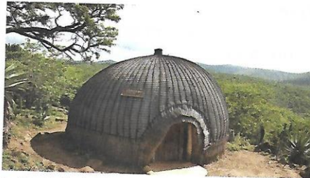
'n Vroeë Zoeloe-hut wat 'n uguqa genoem word.